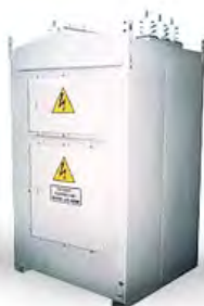
ЯВП (ЯЧЕЙКА ВЫСОКОВОПЬТНАЯ ЛИНЕЙНАЯ)