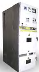
СЕРИИ РТН (КАССЕТНОГО ТИПА, ОДНОСТОРОННЕГО ОБСЛУЖИВАНИЯ)