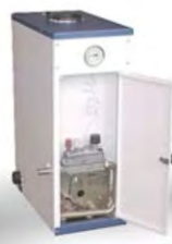
КС-Г (11 КВТ; 12,5 КВТ; 16 КВТ)