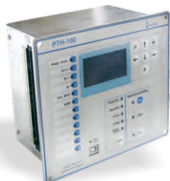
РТН-100 МИКРОПРОЦЕССОРНОЕ УСТРОЙСТВО ЗАЩИТЫ И АВТОМАТИКИ