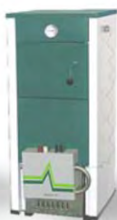
КС-ТГ (16 КВТ; 20 КВТ)