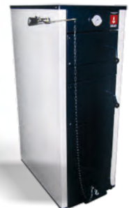
КСТГ-35У (23 КВТ; 45 КВТ)