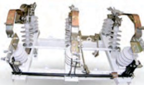
РПК РАЗЪЕДИНИТЕЛИ 10 КВ