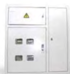
ШО ШКАФ РАСПРЕДЕЛИТЕЛЬНО- УЧЕТНЫЙ (ШИТОК ЭТАЖНЫЙ)