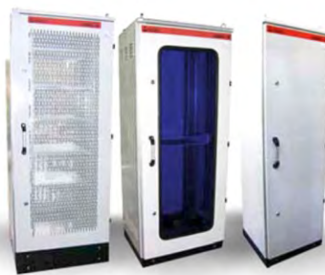
UNIBEL-10 СТРОЙКИ УНИВЕРСАЛЬНЫЕ