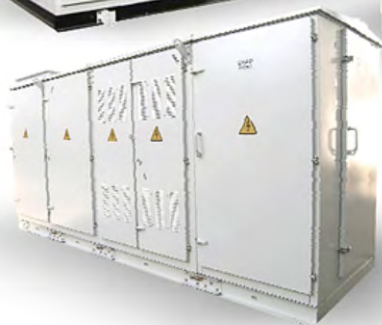
СЕРИЯ КТП-РТН-К (НАРУЖНОЙ УСТАНОВКИ, КИОСКОВОГО ТИПА)