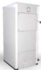
КС-Т (12,5 КВТ)