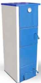
КС-ТГВ (16 КВТ; 20 КВТ)