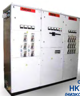
СЕРИЯ НКУ/РТН (НИЗКОВОЛЬТНЫЕ КОМПЛЕКТНЫЕ УСТРОЙСТВА)