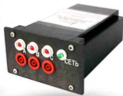
УНН-10 УКАЗАТЕЛЬ НАПЯЧИЯ НАПРЯЖЕНИЯ