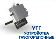
УГТ УСТРОЙСТВА ГАЗОГОРЕПЧНЫЕ