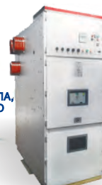
СЕРИИ РТН (20) (КАССЕТНОГО ТИПА, ДВУХСТОРОННЕГО ОБСЛУЖИВАНИЯ)