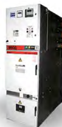
СЕРИИ РТН (КАССЕТНОГО ТИПА, ДВУХСТОРОННЕГО ОБСЛУЖИВАНИЯ)