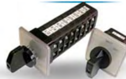
ППК16 ПЕРЕКЛЮЧАТЕЛИ ПАКЕТНЫЕ КОММУТАЦИОННЫЕ