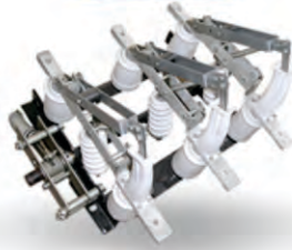
ВН ВЫКЛЮЧАТЕЛЬ НАГРУЗКИ 10 КВ