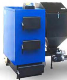
КОС-ТВА (25 КВТ)