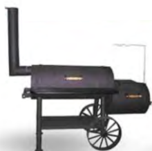
УСТРОЙСТВО ДЛЯ КОПЧЕНИЯ