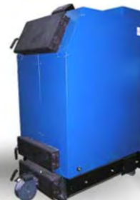
КОС-ТВ (23 КВТ; 45 КВТ)