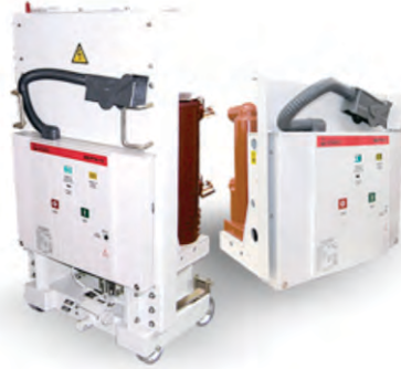
ВВ/РТН-10 ВАКУУМНЫЙ ВЫКЛЮЧАТЕЛЬ