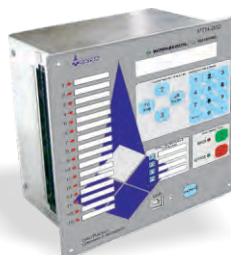
РТН-200 МИКРОПРОЦЕССОРНОЕ УСТРОЙСТВО ЗАЩИТЫ И АВТОМАТИКИ