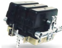
ПВР ПРЕДОХРАНИТЕЛЬ -ВЫКЛЮЧАТЕЛЬ- РАЗЪЕДИНИТЕЛЬ