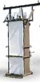
ТСН (ЯЧЕЙКА С ТРАНСФОРМАТОРОМ СОБСТВЕННЫХ НУЖД)