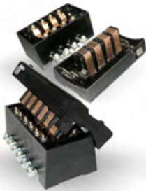
БИ-4 И БИ-6 БЛОКИ ИСПЫТАТЕЛЬНЫЕ