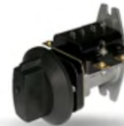
ППКП ПЕРЕКЛЮЧАТЕЛЬ ПОВОРОТНЫЙ КУХОННЫХ ПИИТ