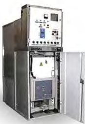
СЕРИИ Р/БЕП (ДВУХСТОРОННЕГО ОБСЛУЖИВАНИЯ)