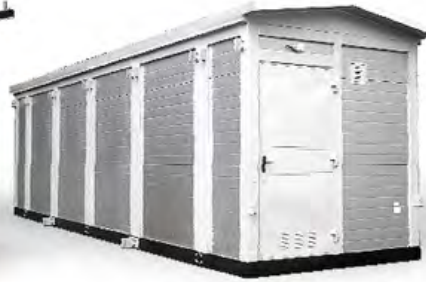
КРУ В МОДУЛЬНОМ ЗДАНИИ (КОНТЕЙНЕРЕ)