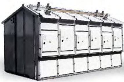
СЕРИИ КРУ/БЕП (ДВУХСТОРОННЕГО ОБСЛУЖИВАНИЯ)