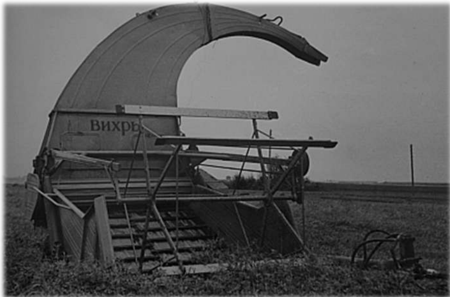
1930 г. – приводная дисковая силосорезка

ГОМСЕЛЬМАШ ведёт отсчёт своей истории с 1930 года. От производства простых сельхозмашин – до создания и массового производства высокопроизводительных зерно-, кормоуборочных комбайнов, комплексов машин на базе универсальных энергосредств и другой сельскохозяйственной техники.