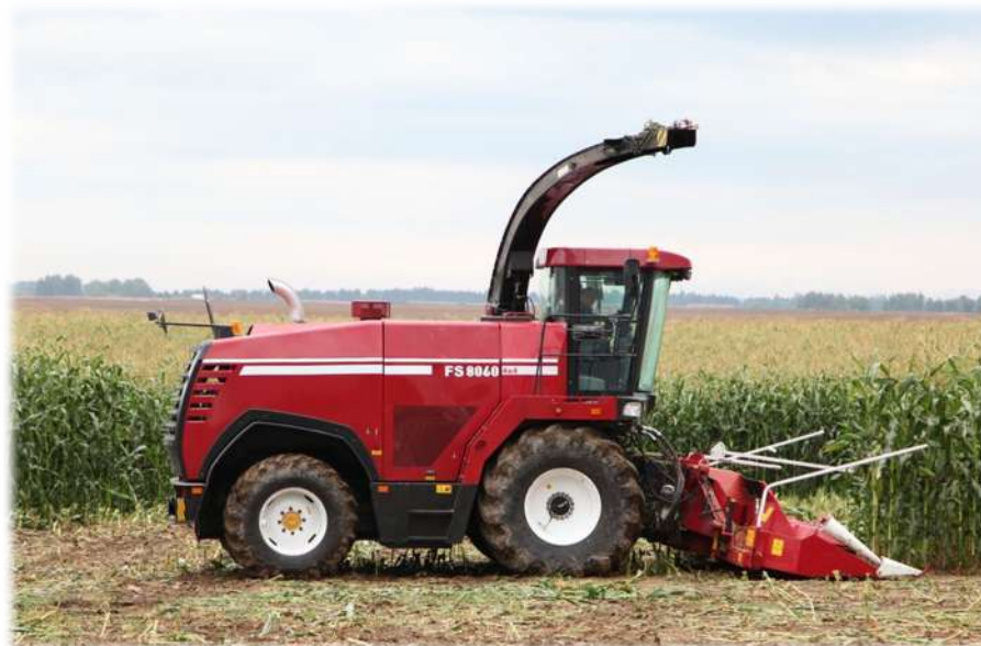
2021 г. – комбайн кормоуборочный высокопроизводительный FS8060