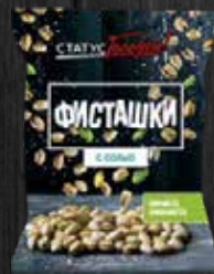
ОБЖАРЕННЫЕ С СОЛЬЮ