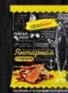
ЯНТАРНАЯ С ПЕРЦЕМ