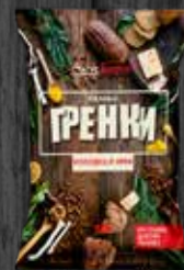
ХОЛОДЕЦ И ХРЕН