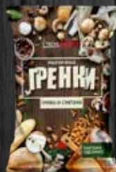
ГРИБЫ И СМЕТАНА