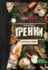
СМЕТАНА И ЗЕЛЕНЬ