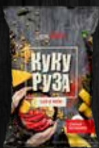
СЫР И ЧИЛИ