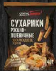
ХОЛОДЕЦ И ХРЕН