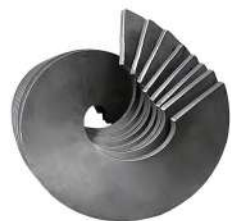
Витки шнека Любой геометрии от 2 до 50 мм толщиной