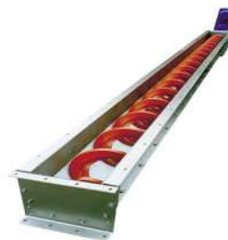
Безосевые шнеки до 20 мм толщиной