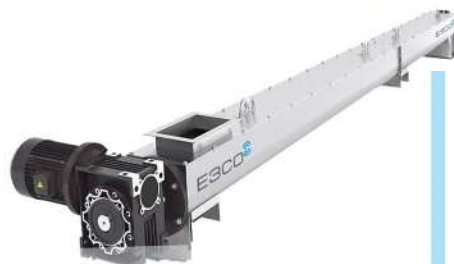
Нержавеющие шнековые конвейера