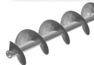
Шнековая продукция любой сложности по Техническому заданию заказчика