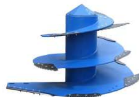
Шнеки для кормораздатчиков Конические шнеки