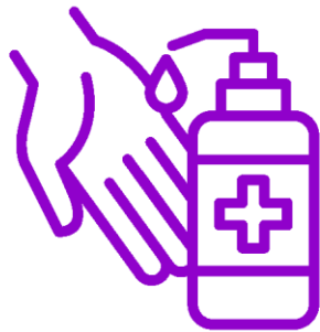
Средства антибактериальные и дезинфицирующие