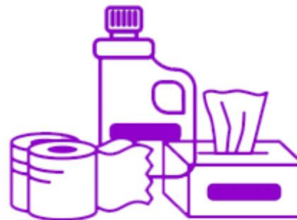
Промышленная химия и санитарная гигиена