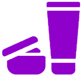
Лечебно- косметические средства