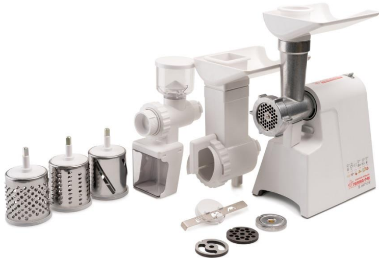
Линейка мясорубок Гамма-7 Мощность 700Вт