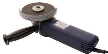
УШМ 0,8 с плавным пуском