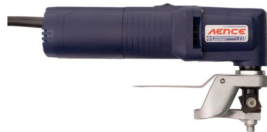
Ножницы ножевые НРЭН 520 2.8

Предназначены для прямой и криволинейной резки металлических листов различной толщины и профилей.