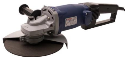
УШМ 2,2-230 с плавным пуском