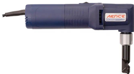
Ножницы вырубные ВЭРН 0.52 П