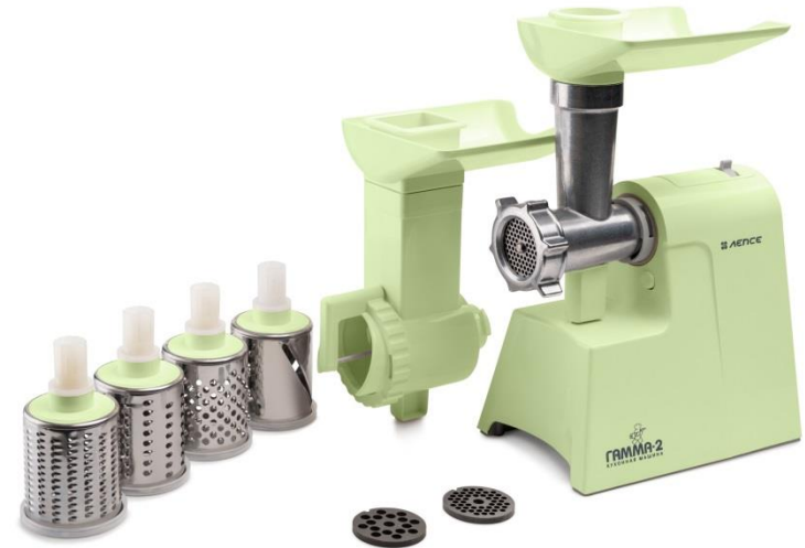
Линейка мясорубок Гамма-2 Мощность 1600Вт