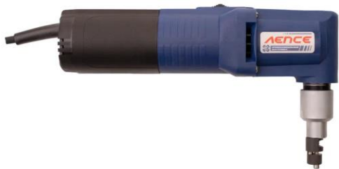
Ножницы вырубные ВЭРН 0.52 2.5