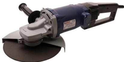
УШМ 1,8-230 с плавным пуском