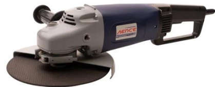
УШМ 2,4-230 с плавным пуском

Предназначены для зачистки, шлифовки, резки металла, обработки бетона, камня и кирпича.