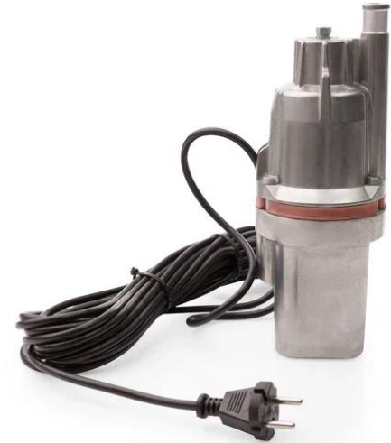
Водолей-5 верхний забор

Насосы предназначены для перекачки и подъёма воды из колодцев, скважин, открытых водоёмов и баков.